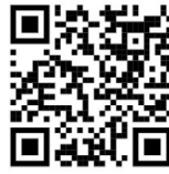
QR Sesión Pública

Este documento es una representación gráfica autorizada mediante firmas electrónicas certificadas, el cual tiene plena validez jurídica de conformidad con los numerales segundo y cuarto, así como el transitorio segundo, del Acuerdo General de la Sala Superior del Tribunal Electoral del Poder Judicial de la Federación 3/2020, por el que se implementa la firma electrónica certificada del Poder Judicial de la Federación en los acuerdos, resoluciones y sentencias que se dicten con motivo del trámite, turno, sustanciación y resolución de los medios de impugnación en materia electoral; y el artículo cuarto del Acuerdo General de la Sala Superior del Tribunal Electoral del Poder Judicial de la Federación 2/2023, que regula las sesiones de las salas del tribunal, el uso de las herramientas digitales.